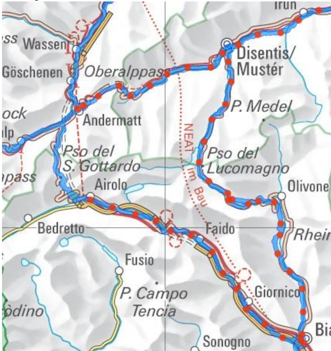
1.Tag: Airolo – Biasca - Lukmanierpass ca. 80 km

Datum Samstag, 9. Juli – Sonntag, 10. Juli 2011 Startzeit 0930 Uhr Startort Bahnhof Airolo Zugverbindung Ab Zürich ab 07:31 direkt bis Airolo