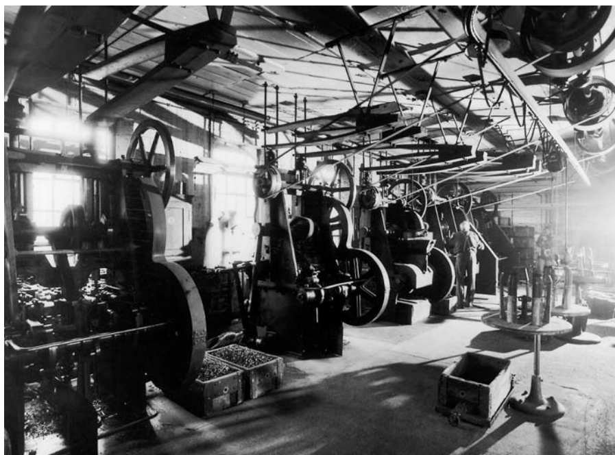
ALTER MASCHINENPARK IN DER SCHWEIZERISCHEN NAGELFABRIK.

Winterthur, die Stadt der Museen, Pärke und Gartensiedlungen, erreichte ihre besondere kulturelle Blüte dank der Industrie. Die Industrie und der für sie gegründete Versicherungskonzern haben Winterthur in der Welt bekannt gemacht.